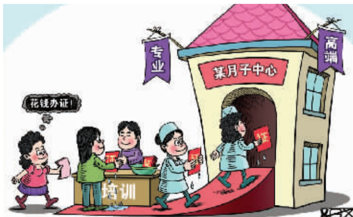
“突击”上岗 新华社发 翟桂溪作